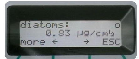
LCD-Display der BenthoTorch