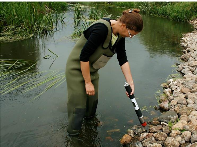
BenthoTorch im Einsatz im AQUAREHAB-Projekt in Dänemark und Belgien

Die bbe BenthoTorch ist ein robustes, wasserdichtes Feldgerät zur Messung von Mikroalgen. Die BenthoTorch ist für die schnelle Quantifizierung von Grünalgen, Cyanobakterien und Diatomeen (Phytobenthos) auf verschiedenen Substraten wie Sedimenten und Steinoberflächen konzipiert. Eine Messung wird in weniger als 15 Sekunden durchgeführt. Einfach einschalten, auf das Substrat halten und die Ergebnisse ablesen.