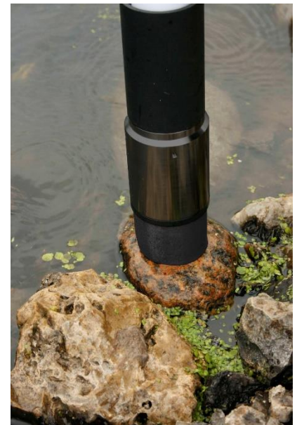
BenthoTorch: Zur Messung von benthischen Algen auf verschiedenen Substraten